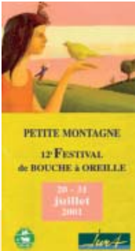
Illustration : Nathalie Nivot

particulièrement dynamique , villes et villages sont le théâtre de toutes sortes d'événements festifs et culturels, qui se jouent de «l'esprit de clocher» comme des «frontières» administratives ! Contrairement aux idées reçues : les Jurassiens aiment sortir, pour peu qu'on leur propose des manifestations de qualité !