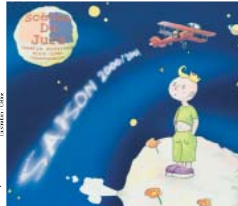
Illustration : Collin